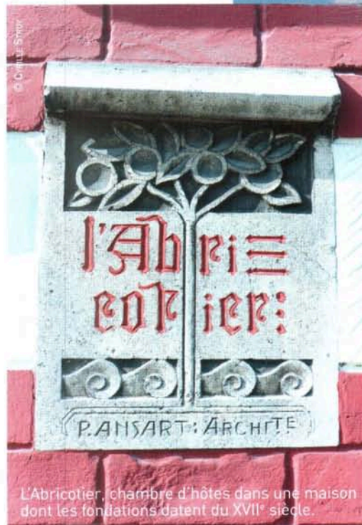
L'Abri-côtier, chambre d'hôtes dans une maison dont les fondations datent du XVII e siècle.

www.noshoes-club.com Les guide de Rando-Nature en Somme : 03.22.26.92.30.